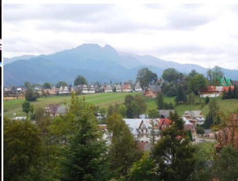
Vue sur les Tatras

L'après midi fut consacré à la visite du traditionnel marché de Zakopane, de la rue principale Krupówka avec ses boutiques en bois.