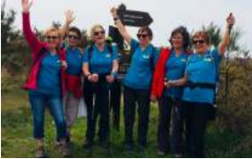
Allez les bleues !

.....A suivre les épisodes suivants sur le rsl44.canalblog.com Josette