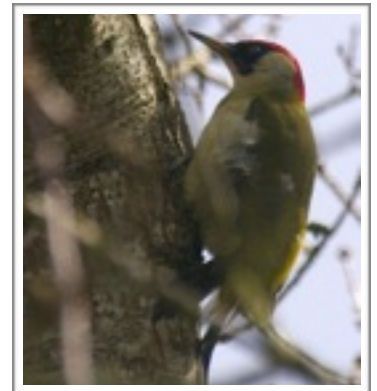
le pic vert