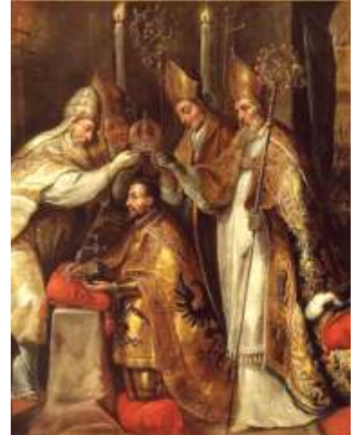
Sacre de François 1 er - 1519