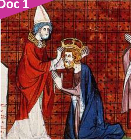
Sacre de Charlemagne en 800