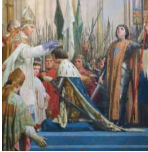
Sacre de Charles VII en 1429