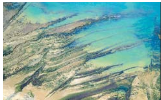
Au nord d'Audresselles.

■ Un livre dédié à Vimy est à l'étude, en collaboration avec une historienne canadienne.