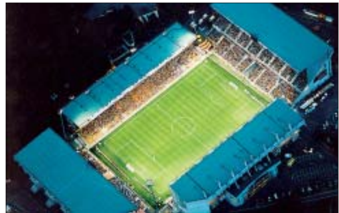
Le stade Bollaert de nuit.