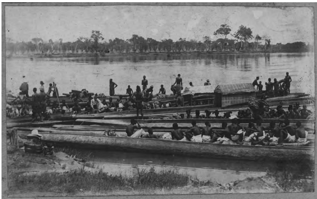
Ill. 1.5. Transport en pirogue. Arrêt en face d'Arengo en Ubangi, 1928. (AP.0.2.7519, collection MRAC Tervuren ; photo 1928.)

sans doute de même racine. Ainsi donc on trouve « ngi » (eau) dans le nom des rivières Ubangi, Gribingi, Bamingi, Bangi-Kete. Et Bobangi signifie, pour lui, « homme d'eau » ou riverain. Tout comme le nom « ngo » se retrouve dans Pongo, le nom d'une rivière de l'ouest de l'Ubangi et d'une rivière du sud-ouest du Soudan du Sud, comme dans les noms des riverains Sango, Bokango, Yango.