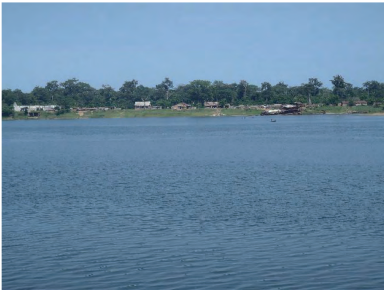
III. 1.1. La rivière Ubangi au niveau de Batanga, premier port créé avant Libenge, situé à 12 km en aval de ce dernier. (Photo équipe locale, mai 2012.)

En 1877, H. M. Stanley, arrivé à l'Équateur au cours de sa descente du fleuve Congo, dessina sur le schéma de sa carte la rivière « Oubangi », sans avoir toutefois eu l'occasion de voir de ses yeux cet affluent. Il confiera au capitaine Hanssens, chef