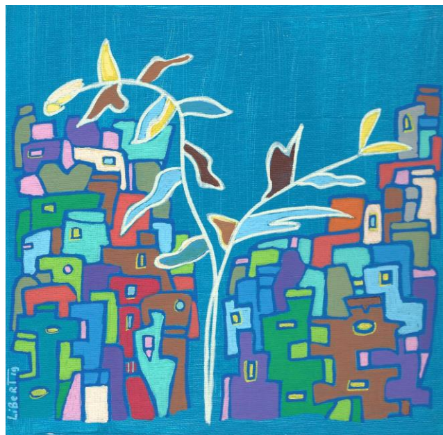
© Béatrice Libert, « Au fond du bleu », série des villes imaginaires, n° 96, 2019 ; acrylique sur carton entoilé, 20 X 20 cm.