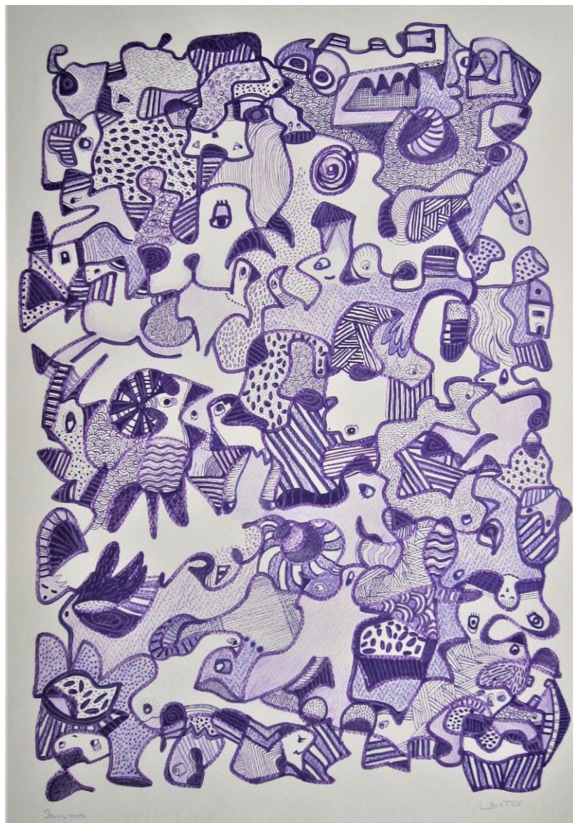
© Béatrice Libert, « Parmi nous », série des glyphogrammes, gouache et crayon sur papier canson, 2020.

Passionnée par l'art sous toutes ses formes, elle a fondé le Festival des Arts à Cointe (Liège) et cosigné plus de cinquante livres d'artistes avec des peintres, graveurs et photographes. Professeur de français à la retraite, elle se consacre à littérature et à la peinture.