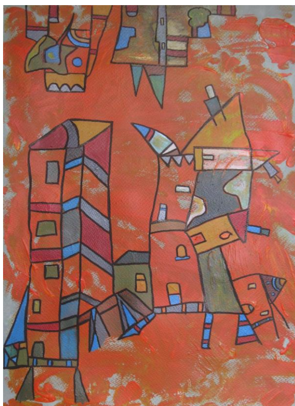
© Béatrice Libert, Ange-ville , acrylique sur papier.

Vernissage – cocktail le samedi 12 novembre de 17h30 à 20h.