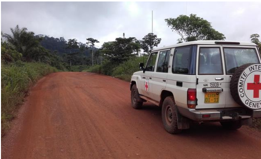
Guinée Forestière, sur la piste entre N'Zérékoré et Yomou.

Pays de 12 millions d'habitants situé entre le Sénégal, le Mali et la Côte d'Ivoire, la Guinée compte 12 millions d'habitants et recèle sur un territoire de 250.000 km 2 des mangroves, des forêts primaires tropicales, de hauts plateaux mais aussi des savanes. C'est un peu au niveau du paysage une Afrique en miniature.