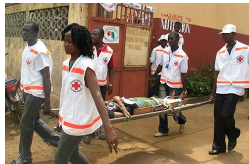
Equipe de volontaires de la Croix-Rouge Guinéenne / Présents sur toutes les urgences.