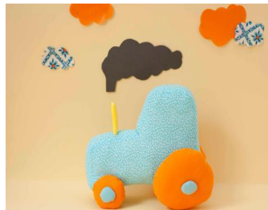
Poc a Poc Création d'objets de décoration et d'accessoires pour enfant contact@pocapoc.fr