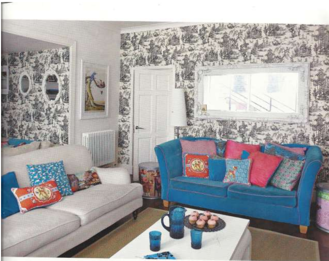
Un papier peint toile de Jouy à motifs noirs habille avec élégance une partie du salon. Le canapé en velours bleu et les coussins Wu & Wu viennent bousculer avec humour ce décor british classique. Sur la table basse, verres et carafe Habitat .