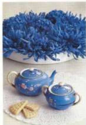
Dahlias bleu roi en tissu dont on a coupé les tiges, dans une coupe Habitat. Et service à thé ancien.