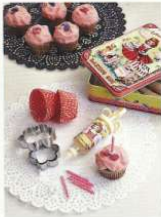
Une des boîtes de la marque Wu & Wu est le set à pâtisserie pour petites filles. Set de table « Napperon », Habitat.