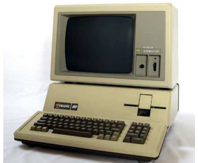
Quelques exemples d'ordinateurs