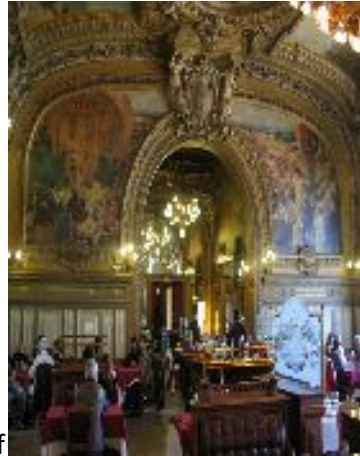
Le train bleu 1900