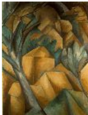
Braque-Maisons à l'Estaque1908

Metzinger (1883 -1956) 31 ans, réformé en 1915