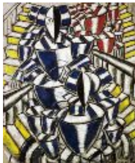
Léger « Tubisme »-L'escalier1914