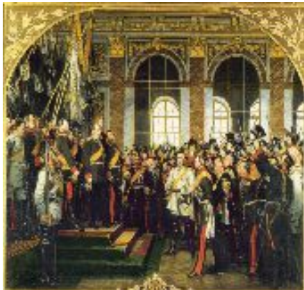
Proclamation de l'empire allemand à Versailles 1871

« Vu la puissance de feu des belligérants, la réalité tactique devenait difficile à représenter selon les canons classiques. » Anton von Werner (1843-1915), peintre allemand spécialisé dans les scènes historiques