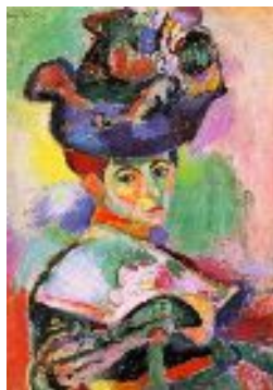
Matisse-Femme au chapeau 1905

Derain (1880-1954), 34 ans, Gontcharova (russe)