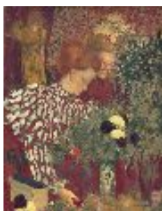
Vuillard-Le corsage rayé