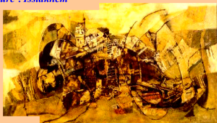
Peinture : Issiakhem