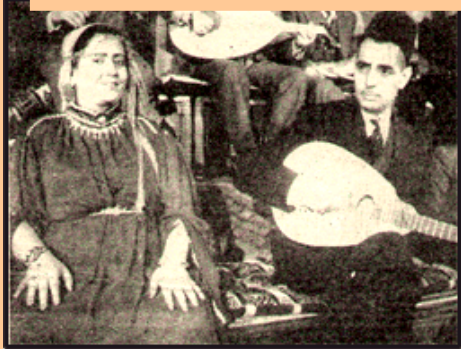
Chants sacrés "Meddah" interprétés par des femmes