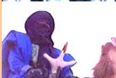
Festival des Touaregs