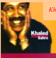
Khaled, roi du Rai