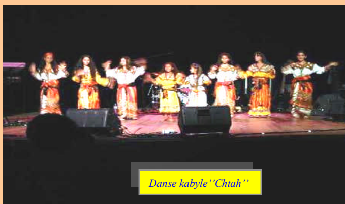
Danse kabyle "Chtah"

L'écrivaine algérienne, Assia Djebbar devient la première personnalité maghrébine à être admise, parmi les 40 "Immortels", sous la coupole de l'Académie française créée en 1635.