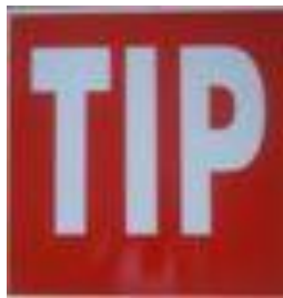
TIP : Temps imposé de Passage