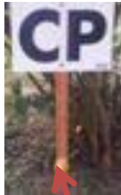
CP avec Pince