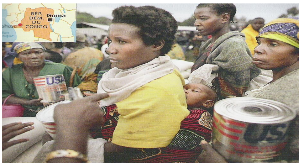
Aide alimentaire dans un camp de réfugiés à Goma (République démocratique du Congo). Le Programme Alimentaire Mondial (PAM) répond aux situations alimentaires d'urgence dans plus de 80 pays. En 2008, 68 % de l'aide était destinée à l'Afrique subsaharienne.

Les pays riches donnent des aides alimentaires, mais pas suffisamment et c'est plutôt bien car sinon ils s'habitueraient et n'essaieraient pas de s'en sortir seuls.