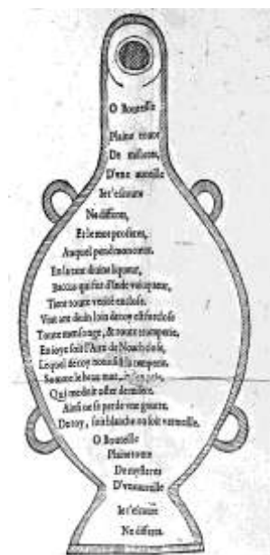
Calligramme de la Dive Bouteille : bibliothèque municipale de Lyon (Réf. 807 489 / Lyon, Jean Martin, 1567)