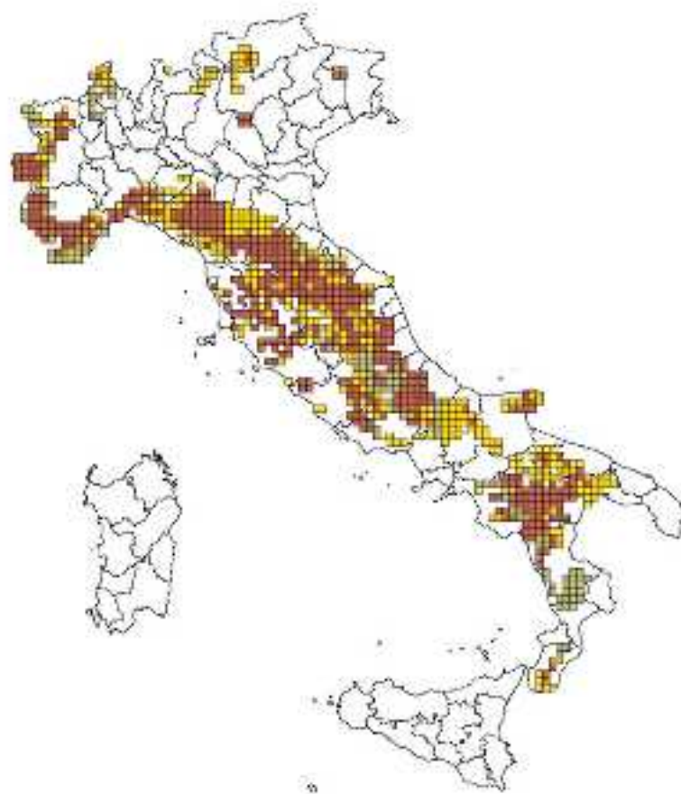
Figura 2. Distribuzione del lupo in Italia nel 2015, ottenuta dalla combinazione e integrazione di dati di varia natura forniti da oltre 150 esperti (marrone = presenza permanente; giallo = presenza sporadica)

Nella mappa in figura 2 è riportata la migliore rappresentazione cartografica della distribuzione del lupo in Italia, ottenuta dalla combinazione e integrazione di dati di varia natura.