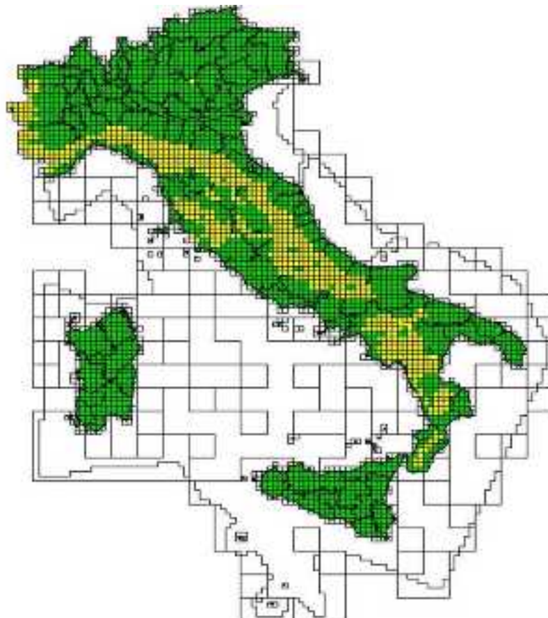
Figura 1. Distribuzione del lupo in Italia nel 2012 (celle 10 x 10 Km 2 in giallo) trasmessa alla Commissione Europea nel 2014 tramite Rapporto sullo stato e tendenze delle specie prioritarie (Direttiva Habitat Art.17).

La carta di distribuzione e la stima di popolazione prodotte nel 2014 (dati 2012) sono la base sulla quale una nuova procedura di raccolta ed elaborazione dati è stata condotta ai fini del presente piano (Fig.1).