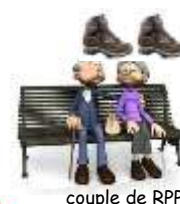
couple de RPP