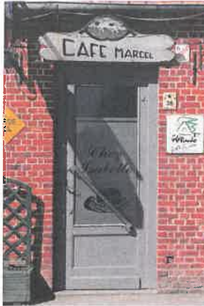
Histoire. Les « cafés-rando » portent souvent plusieurs appellations, témoins de la longue histoire qui les relie à leur territoire.

📍 36 La Place à Buyssechre - ☎ 03 28 43 05 18