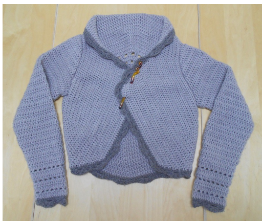
Le gilet mandala vue de face