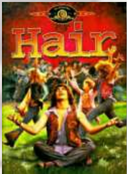
Film de Milos Forman 1979

http://www.ecmisas.com/spip.php?article45