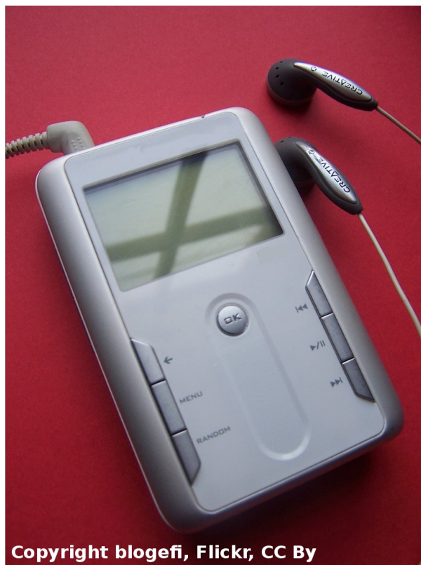
Baladeur numérique

Les balados sont en quelque sorte des émissions maison diffusées sous la forme de fichiers MP3. On peut les télécharger à la pièce ou utiliser un logiciel spécial qui permet de recevoir automatiquement par abonnement des balados sur son baladeur. Il s'agit le plus souvent de fichiers audionumériques, mais on commence à en trouver sous forme vidéo. En quoi la baladodiffusion inquiète-t-elle? Parce qu'il y a de plus en plus de balados pornographiques et que les filtres et autres outils de contrôle parental sont incapables de déterminer le contenu d'un fichier MP3. Bref, il est très difficile pour les parents de vérifier ce que leurs enfants écoutent sur leur baladeur.