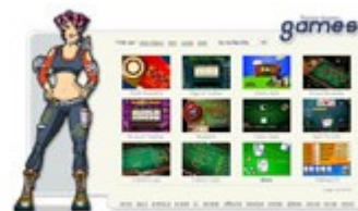
La page d'accueil de France-jeunes games

La prolifération des jeux de hasard et des sites de paris sur Internet n'a fait qu'augmenter le nombre impressionnant de jeunes qui s'adonnent au jeu. C'est devenu chez les adolescents une dépendance plus importante que la cigarette, l'alcool ou les drogues. Selon un sondage de l'Université McGill, 30 pour cent des élèves montréalais de 1 re secondaire jouent à des jeux de hasard au moins une fois par semaine et les adolescents sont de deux à quatre fois plus susceptibles que les adultes de devenir des joueurs compulsifs.