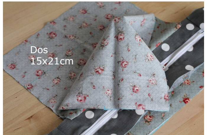
Milieu de la fermeture éclair et du dos/rabat