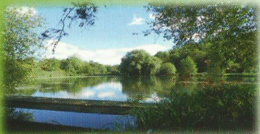
L'étang du restaurant